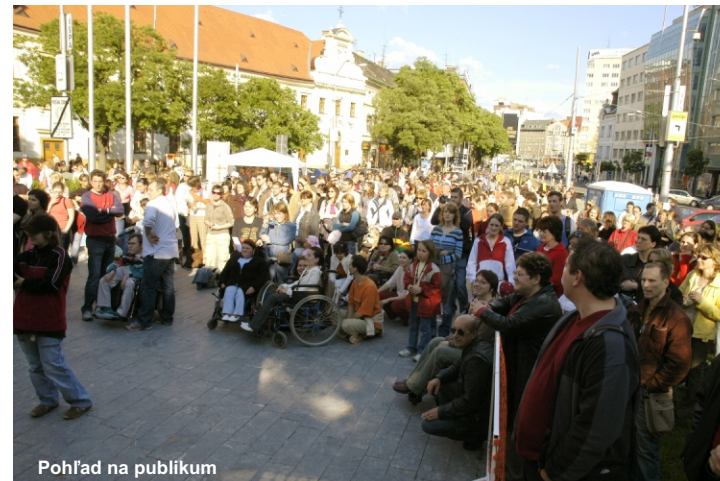
Pohľad na publikum