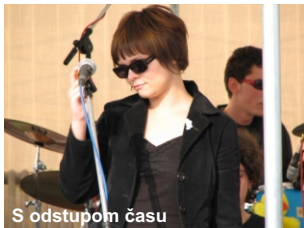
S odstupom času

prinieslo ovocie 8. júna 2006, kedy sme pomyselnou klapkou odštartovali náš koncert. Prvé tóny patrili slovenským ľudovým piesňam v úprave a krásnom vokálnom prevedení Ľudovej hudby FS Považan z Považskej Bystrice. Nasledovalo vystúpenie domácej skupiny Rebelia , ktorá svojou štipkou rockovej muziky rozprúdila krv v žilách divákov. Na takto pripravenú