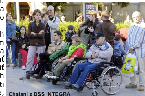
Chalani z DSS INTEGRA

Z prostriedkov poskytnutých nadáciou DANUBIANA môžeme trom mladým mužom zo zariadenia sociálnych služieb sprostredkovať osobných asistentov a oni môžu tráviť svoj voľný čas podľa vlastných predstáv a záujmov a osobní asistenti dostanú za svoju prácu zaplatené, tak,