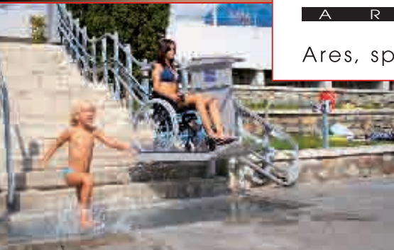
Šikmá schodisková plošina