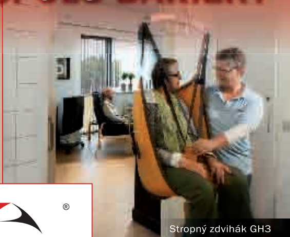
Stropný zdvihák GH3