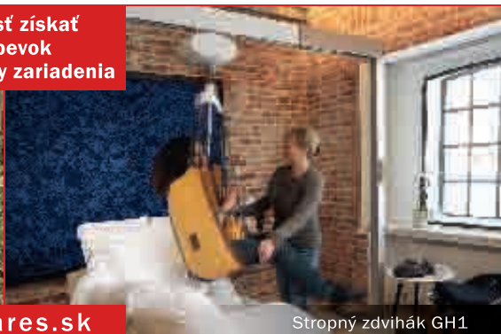
Stropný zdvihák GH1

Možnosť získať príspevok 95 % z ceny zariadenia