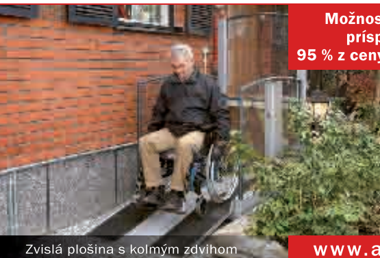
Zvislá plošina s kolmým zdvihom

Možnosť získať príspevok 95 % z ceny zariadenia