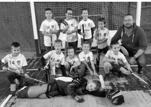
• Aj toto sú strelci – časť mladších prípravkárov

Toto leto sa spolupráca rozšírila aj o poskytnutie florbalového vybavenia na OeMDácky letný tábor pre mladých. Ďakujeme a tešíme sa na ďalšiu spoluprácu!