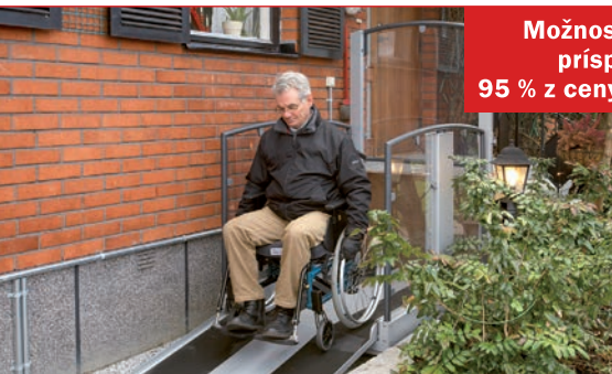
Zvislá plošina s kolmým zdvihom

Možnosť získať príspevok 95 % z ceny zariadenia