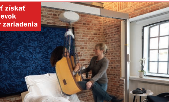
Stropný zdvihák GH1

Možnosť získať príspevok 95 % z ceny zariadenia