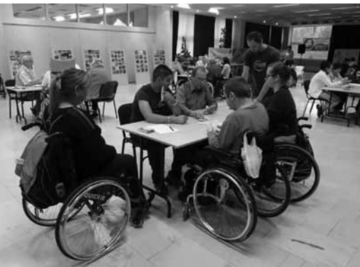
• Skupinka „zapálených“ hráčov zolníka

OMD v SR pri kávičke, čaji, alebo chutnom koláčiku. Rozlúčkový sobotňajší večer sa ukončil tombolou, výťažok ktorej dystrofici pravidelne venujú na charitatívne účely.