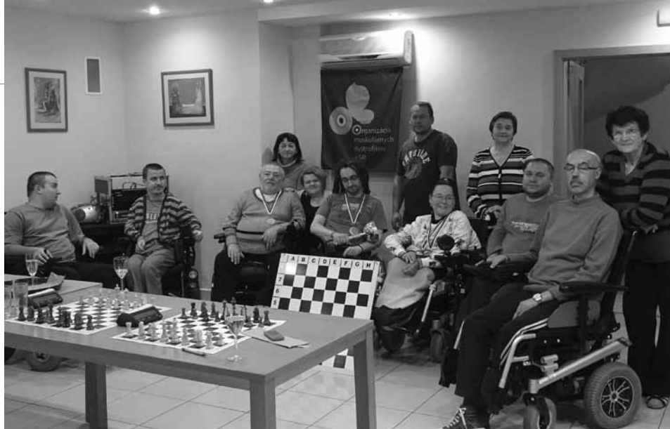
• Šťastní medailisti spolu s ostatnými hráčmi.