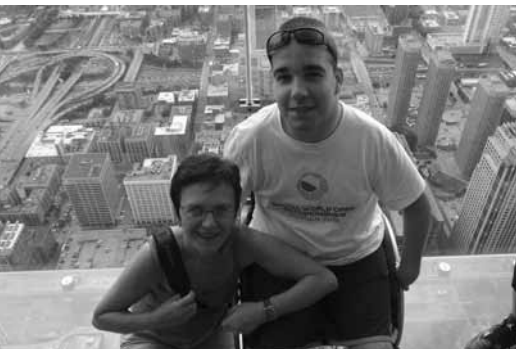
• Výhľad z najvyššej budovy severnej Ameriky „Willis Tower“ bol naozaj impozantný. (Autor: Ján Andrejčík)

aj Capitol Building. Musíte si hovoriť, že sa mýlim, veď Capitol Building je vo Washingtone, ale nie. Každé hlavné mesto 50 štátov USA má svoj vlastný Capitol Building, v ktorom sídli vláda každého jedného štátu. Tá si svoj štát riadi sama, avšak všetky jednotlivé štáty spadajú pod hlavný Capitol a jeho federálnu vládu, ktorá sídli vo Washingtone. Taktiež sa v budove nachádza najvyšší súd a v každej budove sa nachádza aj verná kópia Zvonu nezávislosti.