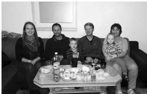
• Milá rodinka Romaňákovcov nás štredo pohostila.