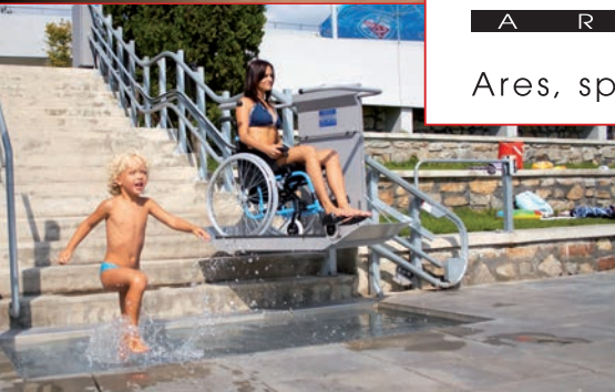
Šikmá schodisková plošina