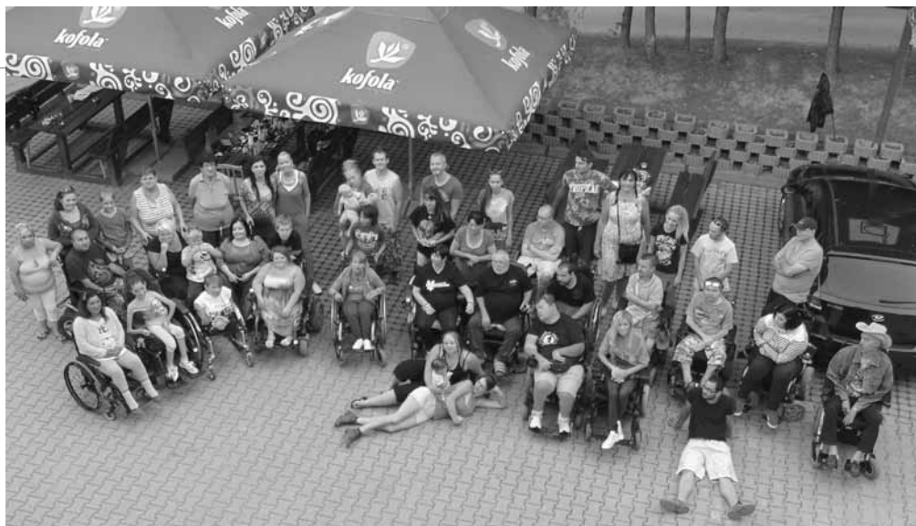
• Veselí táborníci pokope