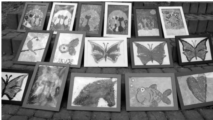
• Hotové veľdiela