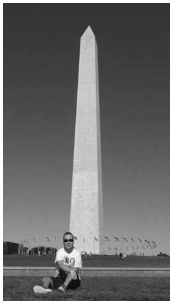
• Washington memorial vo Washingtone DC viacerí poznáme z filmov.

Mesto pohody – aspoň v porovnaní s chaotickým Manhattnom. Impozantné staré budovy, žiadne mrakodrapy, množstvo múzeí (pre zaujímavosť, žiadne vstupné sme do týchto múzeí neplatili – všetky sú zdarma), množstvo pamätníkov – Washington memorial, Lincoln memorial, Jefferson memorial, pamätník padlým vojakom v Kórejskej vojne a mnoho iných pamätníkov.