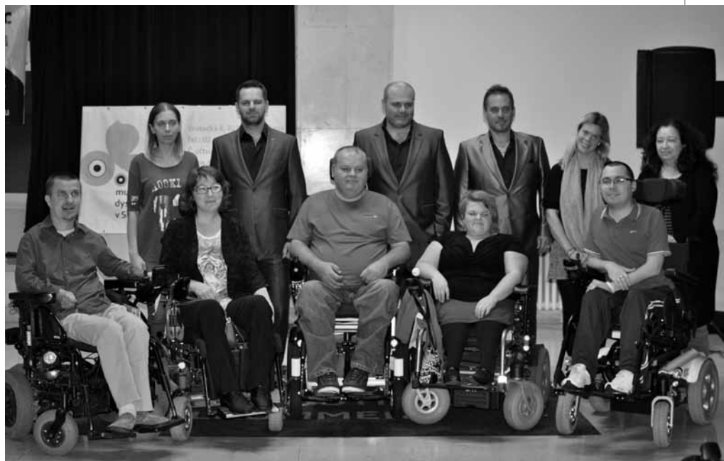
• Aj centrála OMD sa môže popýšiť peknou fotkou so speváckym triom LA GIOIA :)