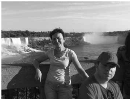
• Cesty naprieč Amerikou nás zaviedli aj k slávnym Niagarským vodopádom.