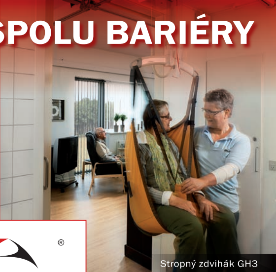
Stropný zdvihák GH3