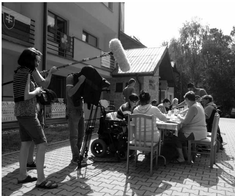
• Kamera v akcii (Autor: Lucia Mrkvicová)