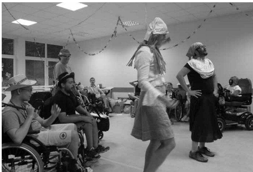
• Takto nás zabávali jednotlivé družstvá

Jednou z ďalších aktivít bola obľúbená nočná hra. Naše družstvá súťažili o truhlicu čokoládových mincí. Na to, aby ju pre svoj tím získali, museli splniť