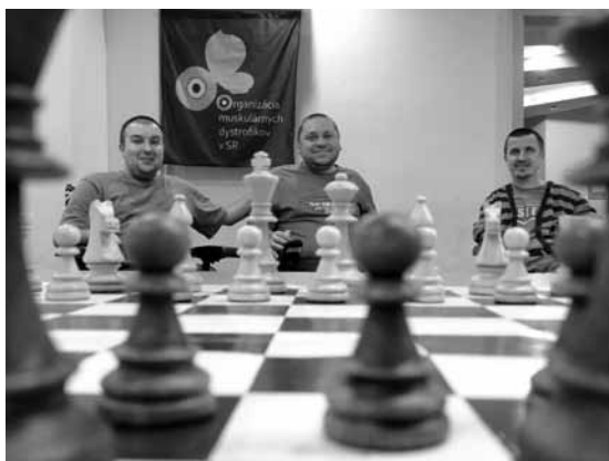
• Na Duchonke bolo ako obvykle veselo.