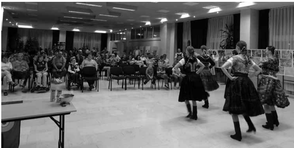
• Náladu nám spríjemnili šikovní tanečníci z folklórneho súboru ŽITO

fantázie 2015 , ktorá bola súčasťou kampane.