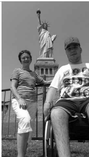
• Výlet v Amerike by sa nám bez fotografie pri Soche slobody v New Yorku ani nerátal :).

Keď sme sa loďou vrátili späť pustili sme sa na 8 hodinové putovanie Manhattanom. Začali sme pri radnici mesta, pokračovali cez Wall Street a známeho zlatého býka, pokračovali sme ďalej k mestskej knižnici (boli sme aj vo vnútri – nádherne a úplne bezbariérová) a taktiež na