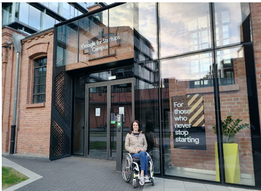
• Google (Autor: Z archívu H.H.)

krásne, veľkolepé. Druhý deň nás čakala prehliadka Centrum Praga Koneser, kde sa konajú rôzne výstavy, koncerty, zábavné podujatia. Je to komplex obytných, kancelárskych a obchodných zariadení v priestoroch bývalej varšavskej továrne na výrobu vodky Koneser. Okrem iného sa tu nachádza napríklad aj sídlo spoločnosti Google.