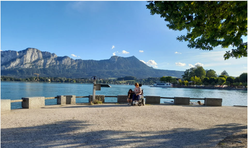
• Mondsee, Dračia stena