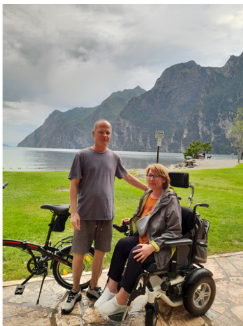
• Lago di Garda

Najdlhšie, dovedna štyri dni, sme po- budli pri jazere Lago di Garda v sever- nom Taliansku, v turisticky vychytenom