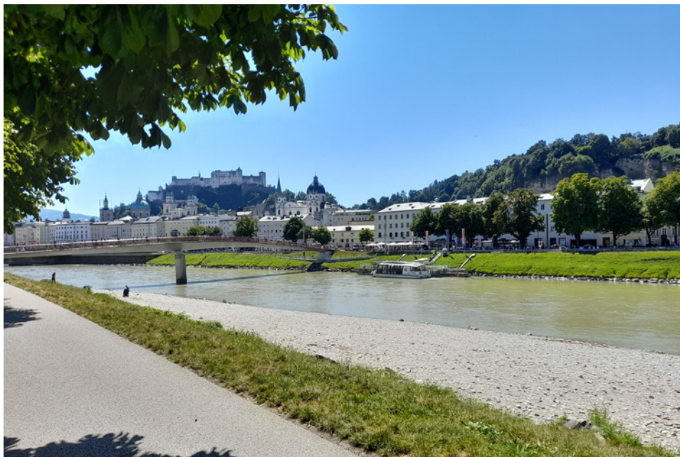
• Salzburg pri rieke

cykloprechádzka ranným, ešte ospalým mestom, v bezprostrednej blízkosti vysokých hôr.