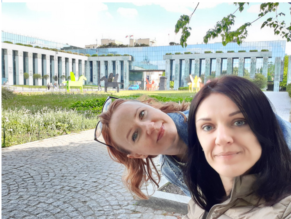
• Budova Európskeho súdu

Varšava ma úplne očarila. Nádherné mesto s vysokými budovami, pôsobí ako poľský New York. Všade čistota, bezbariérovosť, väčšina ľudí chodí po meste na bicykloch. Na každom rohu je obchodík Żabka a stomatológia. Poliáci asi majú o úsmev postarané. Prvý večer sme navštívili Múzeum dejín poľských Židov, keďže tu práve prebiehala Noc múzeí. Späť do hotela sme cestovali taxíkom, mohla som si teda vychutnať uchvátenie nočným mestom. Všetko vysvietené,