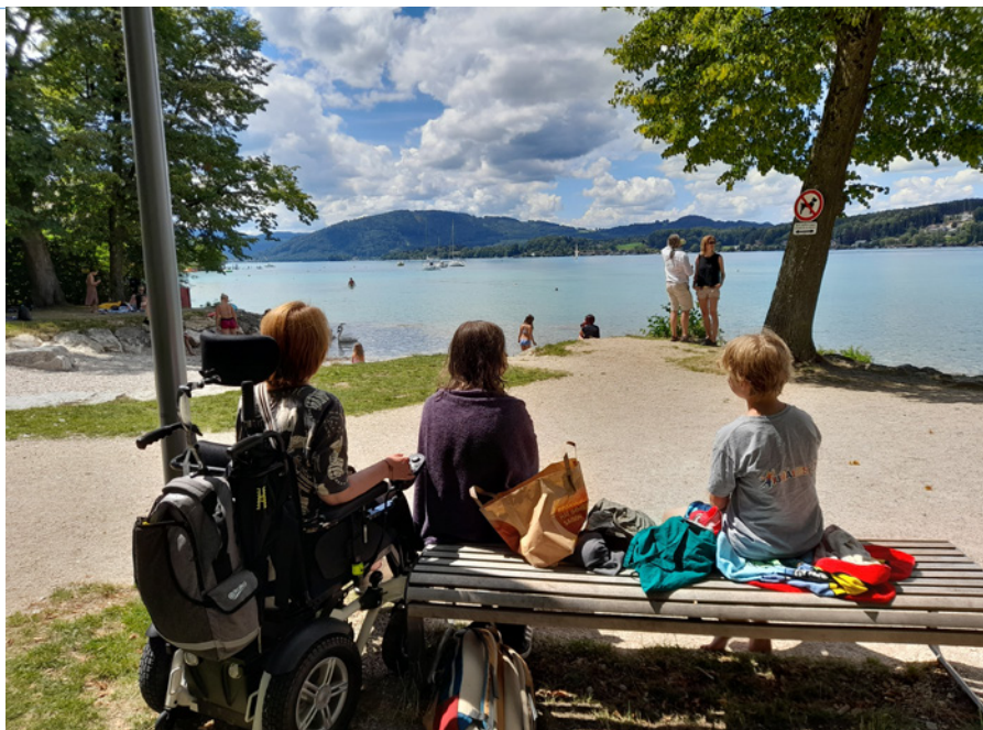
• Dovolenková atmosféra