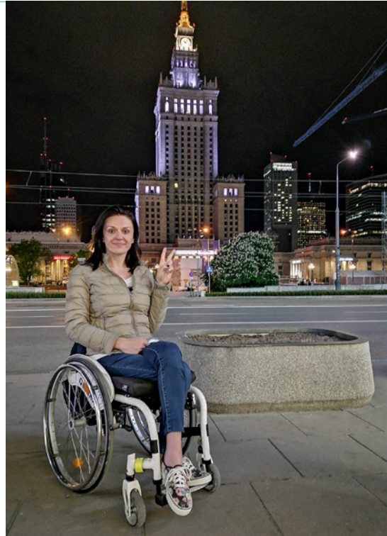
• Vysvietený Palác kultúry a vedy