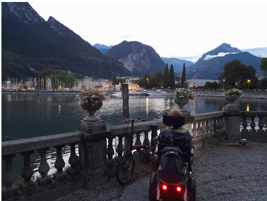
• Lago di Garda večer

mestečku Riva de Garda , ktoré sa nachádza celkom na vrcholku jazera. Okolo jazera je dosť cyklotrás, vhodných aj pre elektrický vozík, takže nie je núdza o dlhšie prechádzky s výhľadom na jazeru. Najkrajší zážitok máme z výletu do neďalekého Malcesinea, kde je lanovka na vrch Monte Baldo – bezbariérová. Na vrchole hory sú nádherné výhľady na Lago di Garda, alebo na opačnú stranu pohoria, s výškovým prevýšením takmer 1800 m.