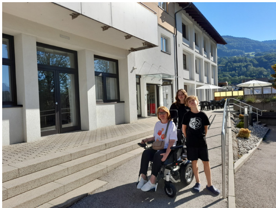
• Mondsee, Študentský domov