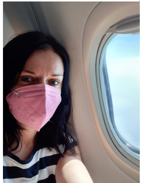
• V oblakoch smerom do Varšavy

Otázka už len znela – ako sa tam dostaneme. Pôvodne sme chceli ísť vlakom, ale nakoniec som sa nechala nahovoriť na cestovanie lietadlom. Pravdupovediac, dala som si to sama sebe ako výzvu. Neletela som 22 rokov, takže to bola pre mňa ako nová skúsenosť a zážitok. Bola som z toho pomerne dosť