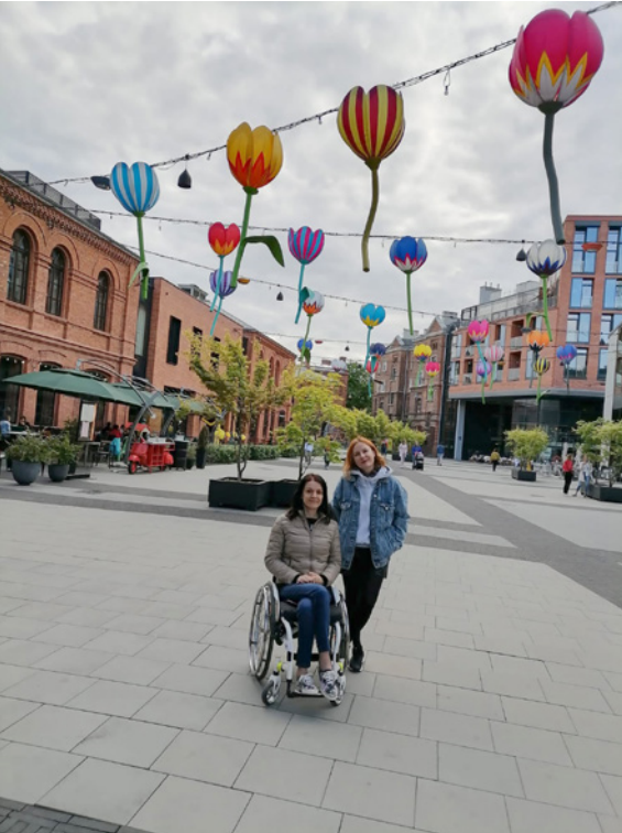
• Centrum Praga Koneser