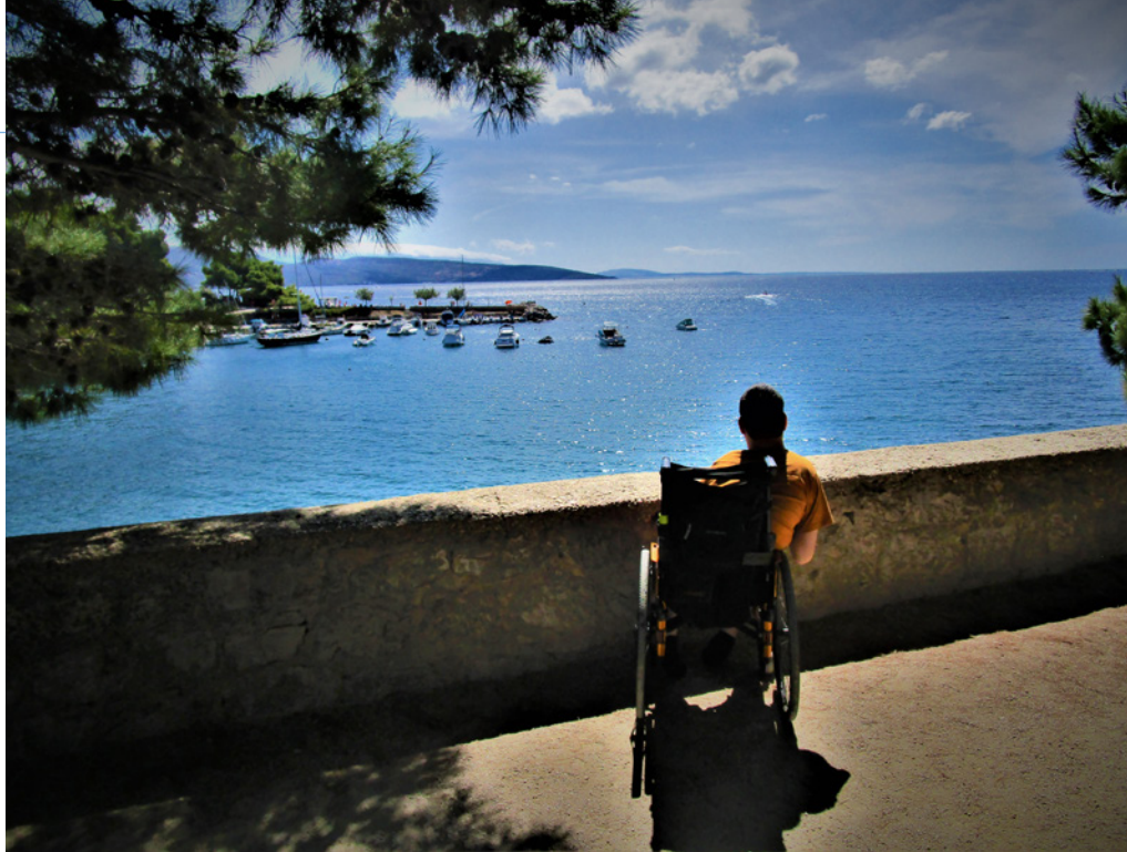
• Bezpečnosť pevnosti na Krku mi, no, zostala na krku

neprehľadnej ostrej zákruty. Tono, čoby skúsený šofér s tisíckami najazdených kilometrov, stočil auto do dvora nejakého domu. Museli sme sa uhnúť divokému motorkárovi za nami a obrovskému autu pred nami. Po krátkom vydýchnutí si na dvore sme sa opäť začali štverať hore Terstom. Cesta cez Terst bola akoby za trest. Našťastie sme sa nakoniec vyšplhali na hlavnú cestu, motor sa ukludnil a po tolke námahe už len spokojne a ticho vrčal. Skoro celú cestu naspäť do Rijeky sme s úľavou mlčali.