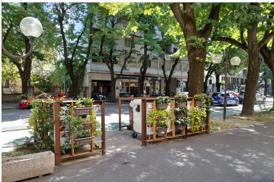
• Monfalcone