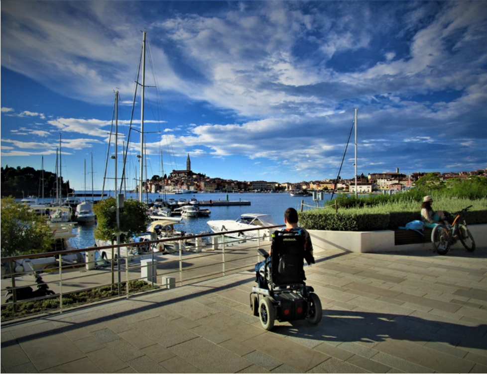
• Rovinj klame názvom. Na rovine sa takmer vôbec nenachádza (Autor: Anton Puk)

zasadené na polostrove, okolo ktorého obteká Jadranské more. Po dlhom hľadaní vhodného parkovania sme sa stretli na nábreží zo zvyškom našej rozšírenej skupiny. Okrem nás tam však bolo neskutočne veľa turistov. Veľmi často bolo počuť nemčinu, občas taliančinu, samozrejme aj domácu chorváťčinu a som si istý, že aj našu rýdzo slovenskú, bratislavsko-oravskú skupinu bolo počuť dosť výrazne. Väčšinu času sme sa držali na nábreží a hore kopcami sme sa nevybrali. Predsa len, pre naše vozíky by taká cesta nebola úplne vhodná. Na severnej strane nábrežia som videl medúzy – prvýkrát v ich prirodzenom prostredí. Mimochodom, info pre jazdcov na