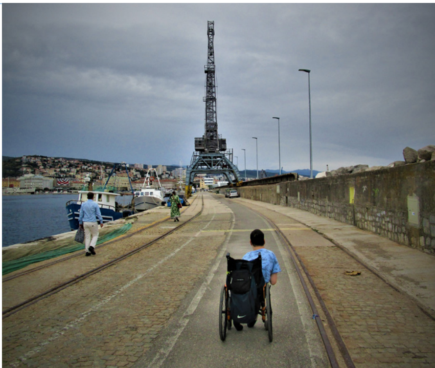
• Načo chodiť do Paríža, keď môžete Eiffelovku vidieť aj v prístave mesta Rijeka

nostalgia. Sadli sme si ku stolu, objednali si šunku jamón, k nej biele víno a cesta spomienok na hlavné mesto Andalúzie navštívené pred rokom sa začala. Opojený dobrým jedlom, vínom a flamencom znejúcim z reproduktorov som si na hotel odniesol príjemné pocity.