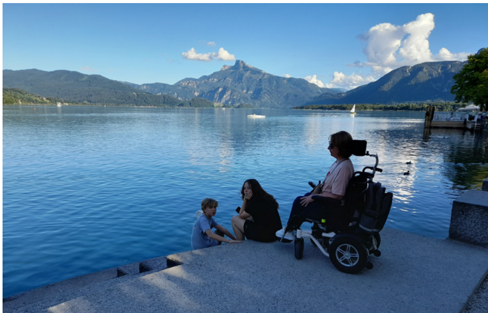
• Mondsee, jazero