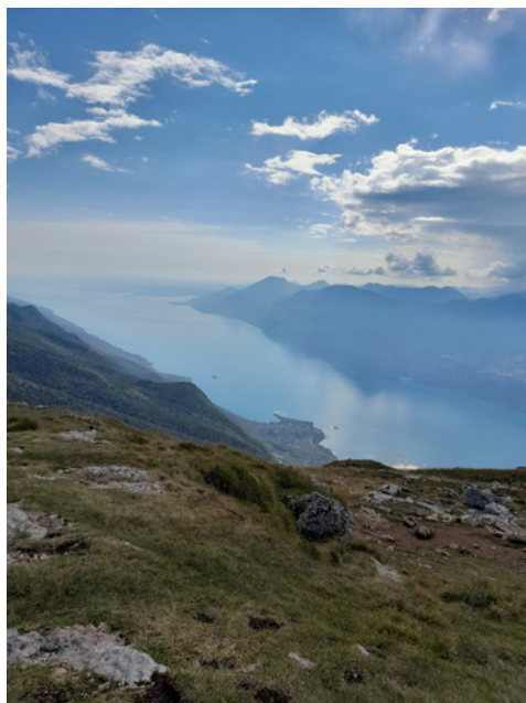
• Monte Baldo lanovka

Monfalcone – dvojďňová zastávka pri slanej vode. Verejná pláž, tzv. spiaggia publica, prístupná a plne vybavená pre ľudí na vozíku. Už z diaľky bolo vidno plážový vozík s veľkými kolesami, boli tam aj bezbariérové WC. Obidva dni tak fúkal vietor, že naša nafukovačka odletela takmer do susedného talianskeho