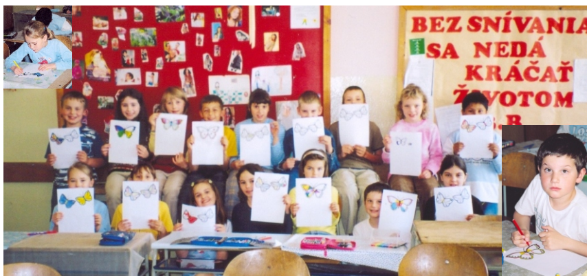
Kreslením motýlikov sa do prípravy zapojili aj žiaci 3. B, členovia Základného kolektívu Ideálnej mládežníckej aktivity pri ZŠ na Krátkej ul. v Šali

Ďakujeme všetkým, ktorí sa do zbierky zapojili; i tým, ktorí sa na nej zúčastňujú každoročne, i tým, čo do „boja“ vytiahli prvýkrát. Tento raz sa motýliky rozleteli v 25 mestách. Úžasné! Veríme, že to bude inšpiráciou aj pre mestá, v ktorých sa tohto roku zbierka nekonala.