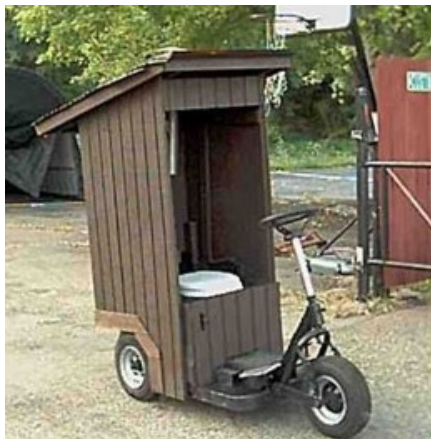
Vítame každú iniciatívu na kompenzáciu...