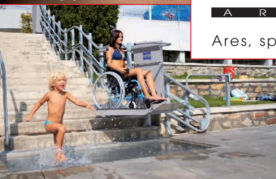
Šikmá schodisková plošina