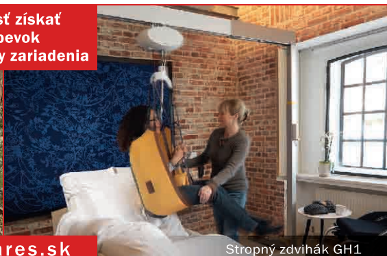
Stropný zdvihák GH1

Možnosť získať príspevok 95 % z ceny zariadenia