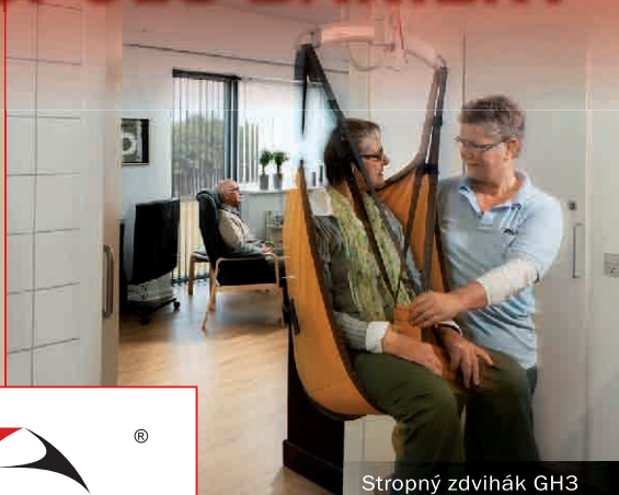
Stropný zdvihák GH3