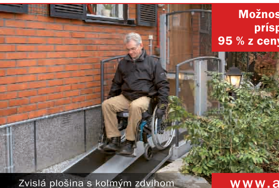
Zvislá plošina s kolmým zdvihom

Možnosť získať príspevok 95 % z ceny zariadenia