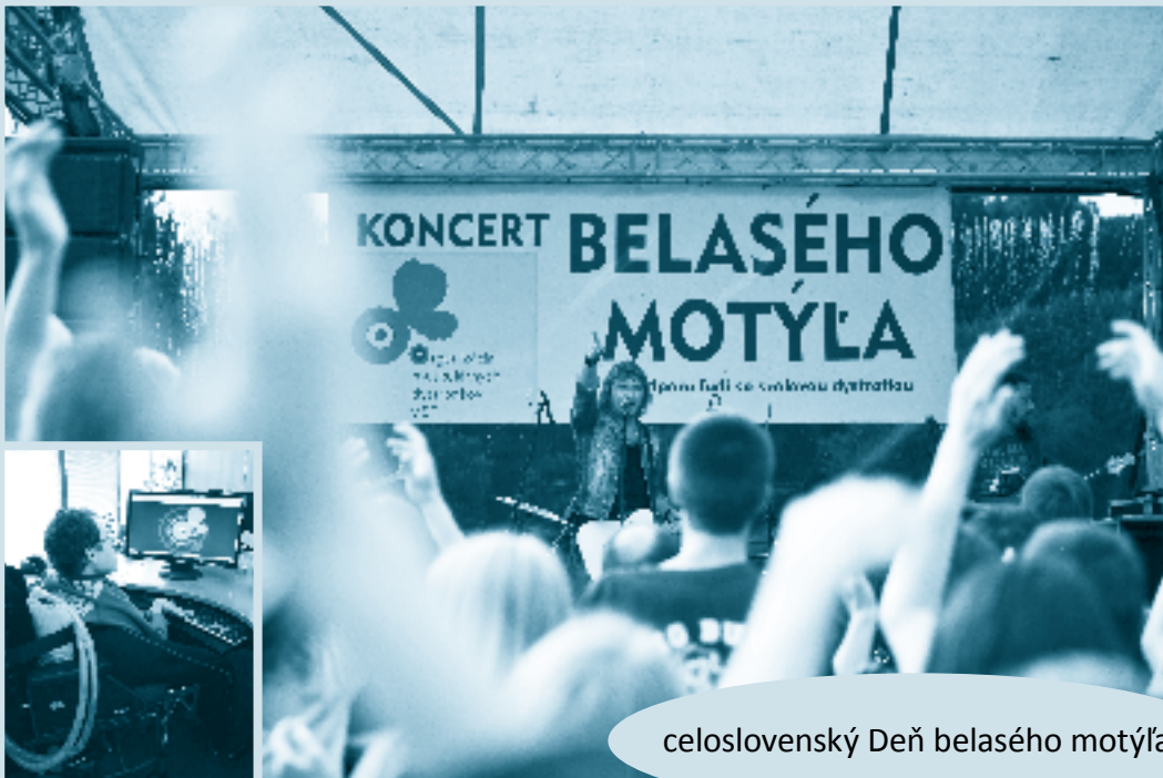
celoslovenský Deň belasého motýľa

Presadzujeme filozofiu nezávislého života = aktívne a rovnocenné zapojenie nás, ľudí s postihnutím, do spoločnosti