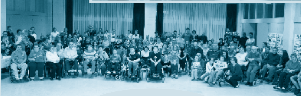
celoslovenské stretnutie členov