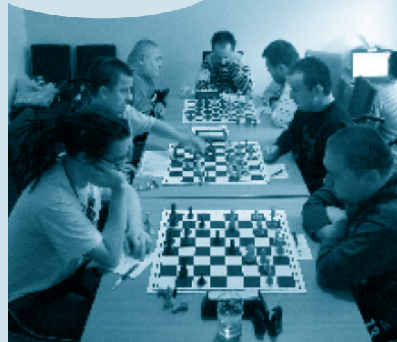
turnaje v šachu