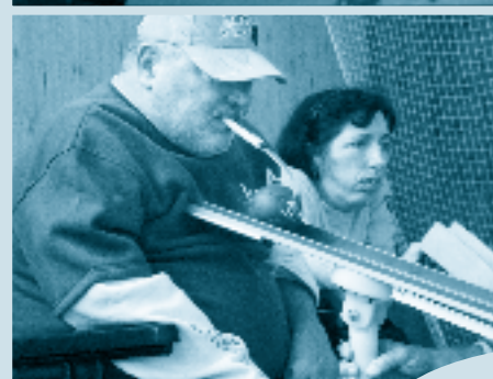
tréningy a turnaje v športovej hre boccia