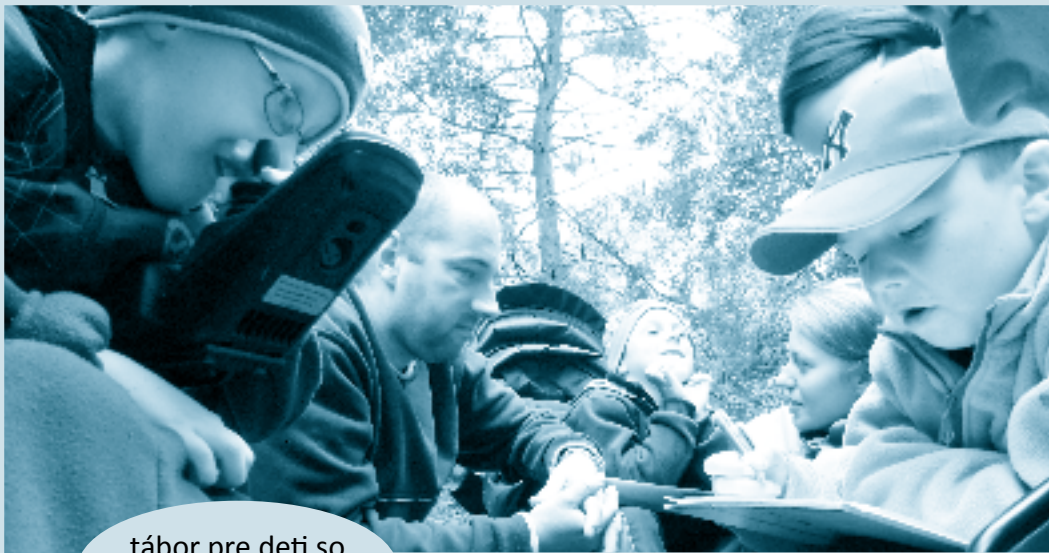
tábor pre deti so svalovou dystrofiou